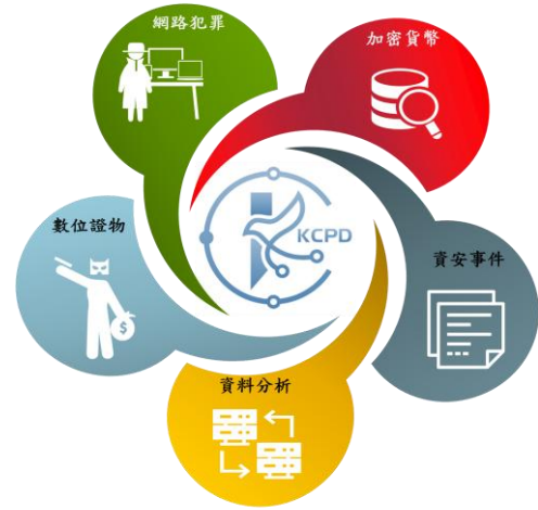
圖 2 科技偵查應用範圍

偵隊)，又 111 年 5 月為提升科技偵查及數位鑑識量能再於各分局及直屬隊成立科技偵查小隊（下稱科偵小隊），近 3 年度（111 至 113 年度）持續提升人才培力作業，並為優化科技偵查及數位鑑識技術，向中央申請補助款計 6,433 萬餘元，購置數位鑑識硬體、電腦（手機）鑑識及虛擬通貨分析軟體等設備，期提升打擊犯罪量能，經查業務執行情形，核有：(1) 配合科技偵查人才教育訓練計畫，鼓勵同仁積極取得資訊安全等相關專業證照，並辦理基礎及初階課程人員教育訓練，惟取得專業證照者仍未臻適足，如行動裝置鑑識專業證照，截至 113 年底取得入門行動裝置資料擷取及中階行動裝置資料分析等證照者，僅為 2 人及 5 人；