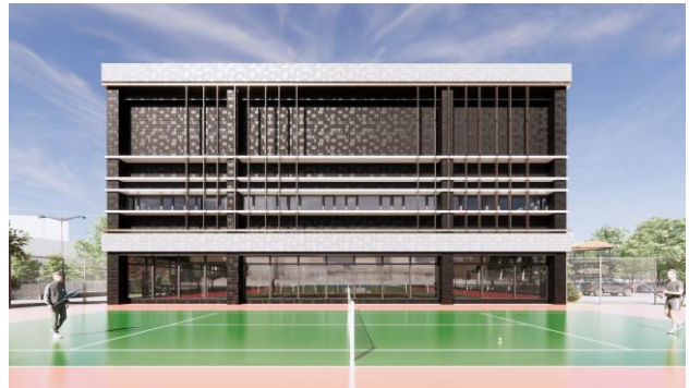
圖3 新生公園網球場改建全民運動館完工示意圖