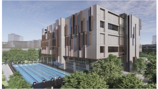
圖2 克強公園游泳池改建全民運動館完工示意圖

體育局為充分照顧各年齡層、不同運動需求的民眾，讓市民享受及擁有優質運動資源，規劃將已使用多年及設施有限之克強公園游泳池，改建為地上5層、地下2層建築物，包含室內及戶外游泳池、各式綜合球場及教室、兒童體適能中心、停車場等空間（圖2）；並規劃將原新生公園網球場及游泳池拆除，改建為地上3層、地下1層建築物，包含體適能中心、運動教室、多功能教室、親子休憩空間及綜合球場，並設置室內射擊靶場作為場館主軸特色，而戶外仍保有游泳池、網球場、籃球場等複合式運動場（圖3），經辦理「克強公園游泳池暨新生公園網球場改建全民運動館統包工程」，於111年8月23日決標，契約金額10億5,182萬餘元，並於111年9月2日開工，截至113