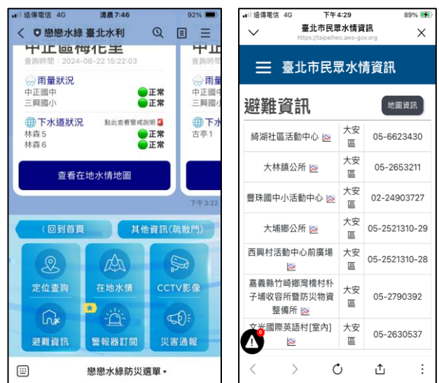
圖2 水利處官方LINE之防災功能避難資訊錯誤情形

2. 部分下水道水位站及獨立閘門等監測設備未能與水情展示系統正常連線，且異常情事遲未排除，亟待檢核修正；3. 未針對歷史淹水次數較多地區優先設立水患自主防災韌性社區，且預計設立標的於執行過程中多有調整，有待檢討先期評估作業，並研謀提高社區參與之意願；4. 經將防水閘門補助位置套疊淹水模擬圖，發現模擬淹水範圍內大部分區域之居民未申請設置防水閘門，且已補助施作地點尚非淹水潛勢較高區域；5. 水利處「戀戀水綠 臺北水利」官方LINE群組啟用智慧防汛功能，惟使用率仍有成長空間，且避難處所資訊未盡正確（圖2）等情事，經函請檢討