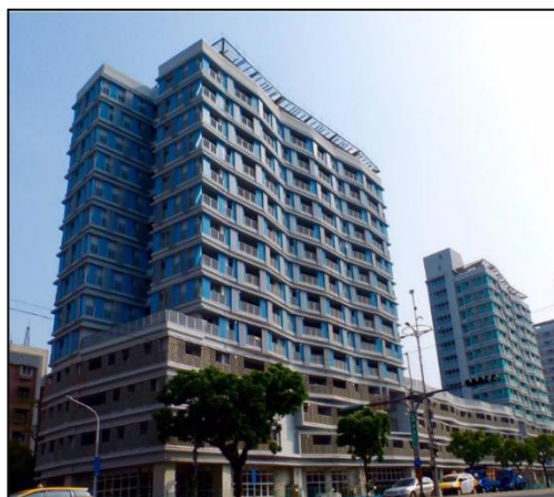
臺北市健康社宅外觀

臺北市政府為推動臺北市住宅及都市更新政策，保障居住權益，改善生活環境，依據行政法人法第 41 條第 2 項規定，於 110 年 12 月 20 日制定公布「臺北市住宅及都市更新中心設置自治條例」，並於 111 年 5 月成立臺北市住宅及都市更新中心（下稱住都中心），嗣將已興建完成 27 處社會住宅，擇選 16 處於 111 年 6 月起陸續委託該中心管理。另住都中心將受託管理之社會住宅按其屬性及其區劃分為東、西、南、北 4 區，並於 111 年 11 月分別辦理 4 件勞務採購案，委託廠商（下稱管理維護廠商）執行社會住宅管理維護工作，契約金額合計 1 億 1,021 萬元，履約期間為 112 年 1 至 12 月。經查執行情形，核有：1. 明倫社宅管理維護廠商於 112 年 6 至 10 月間辦理免治馬桶主機版更換等 11 項檢修項目，屬原新建工程廠商保固範圍，卻以該社會住宅維護經費支應檢修經費；2. 健康社宅前於 111 年 2 月至 12 月間報修之房舍漏水案，據該社宅 112 年 2 月定期檢討會議紀錄所列仍持續列管中，顯示前揭報修案件修繕期程長達數月，甚已逾 1 年仍未改善完成，影響住戶權益；3. 健康社宅管理維護廠商於履約期間未派足清潔人員及駐點行政助理，惟住都中心僅依實際派員狀況減少價金給付，而未督促管理維護廠商即時補足人力並依約扣罰，有降低公宅整體服務品質之虞等情事，經函請臺北市政府研謀妥處。據復：1. 都市發展局已偕同住都中心及管理維護