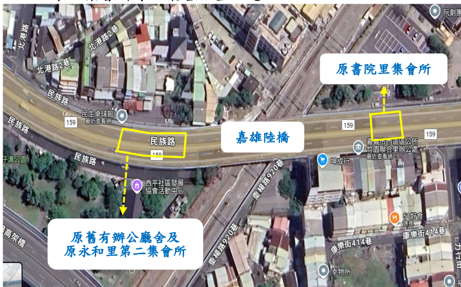
圖 2 嘉雄陸橋下原書院里集會所、原舊有辦公廳舍及原永和里第二集會所等 3 廳舍位置示意