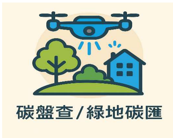
圖8 Geo-AI高綠覆率區域碳匯調查示意

座，惟其中設有共融主題之遊戲場者（登錄於嘉義市友善生活資訊網）僅有嘉義公園鳥巢盪鞦韆、中正公園及文化公園等 3 座，約占全數之 11.11%。又雖已於 112、113 年間陸續編列預算辦理北香湖公園樂齡健康訓練場工程、文化公園及番仔溝公園兒童遊戲場環境設施改善計畫等，惟工程因多次流標等情致工程進度未如預期，允宜加強辦理；2. 113 年度委外維護經費包括清潔管理費約 3,200 萬元，其中「嘉義市嘉義公園及都會森林公園環境清潔管理」案，及「嘉義市西區各公園環境清潔管理」案之成果冊，廠商未依 113 年度各公園環境清潔管理工作說明書規定確實提供履約照片，建請參諸其他市縣管理作法，建置電子化流程精進履約管理之案例，減輕以傳統人力審核維護文件之繁瑣，及保管大量履約資料之壓力；3. 導入無人機航拍技術，應用 Geo-AI 進行轄內公園、校園綠地等高綠覆率區域碳匯調查（圖 8），提升碳盤查效率，據該府提供之研究成果顯示，其中嘉義公園（含嘉義樹木園），每月碳吸存總量達 24 公噸，允宜持續擴展分析範圍，以加速綠地碳匯蓄存量之掌握；4. 為運用嘉義公園豐富之人文歷史及自然資源，委外辦理環境教育場所認證輔導專案執行進度落後 7 個月餘，允宜加強辦理，以早日提供民眾更完整之多元環境教育專業服務；5. 截至本室抽查日（114 年 4 月 30 日）止，文化公園遊戲場設施經陳報主管機關完成備查已逾 3 年，惟尚未委託專業檢驗機構進行遊戲場定期