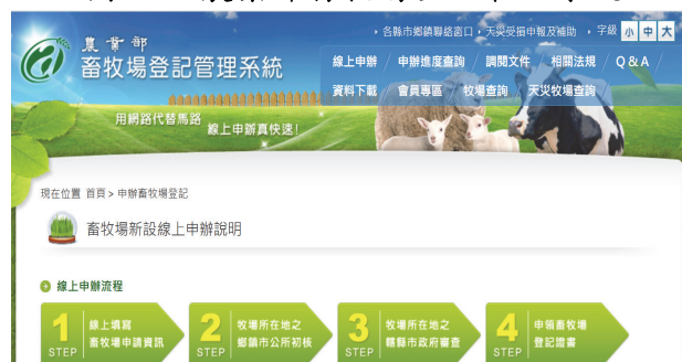
圖 22 農業部畜牧場登記管理系統

新竹縣政府配合農業部持續推動畜牧場登記與管理計畫及查察工作，並運用農業部建置之畜牧場登記管理系統(圖 22)管理登記證核發及畜牧場聘置獸醫師情形，截至 113 年 9 月底止，核發仍有效之畜牧場及畜禽飼養登記證共計 349 場。經查辦理畜牧場管理及稽查情形，核有：1. 迄 113 年 9 月底止，計有 11 個直轄