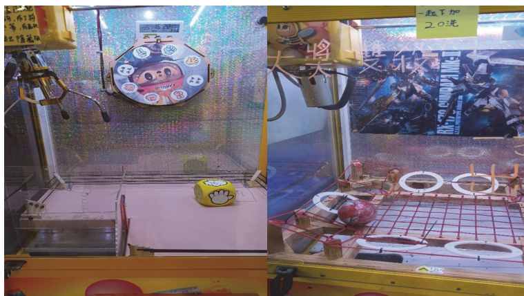
業者設置違規機臺

https://choule.co/map) 篩選新竹縣夾娃娃機店家設置熱區，並運用秘密客稽核調查方法，就竹北市、湖口鄉、竹東鎮、寶山鄉等鄉鎮市，夾娃娃機店家設置較密集之區域，隨機擇選觀察店家營業情形，發現有 38 家業者於設置機臺擅自加裝影響取物可能性之裝置、骰子台、圓盤、輪盤、或保證取物上限金額超過新臺幣 990 元、或擺放