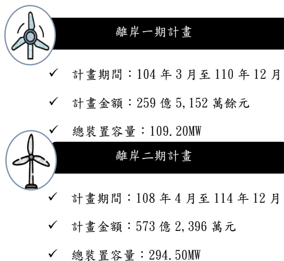
圖6 離岸一、二期計畫簡介

(1) 離岸一期計畫已完工商轉發電3年餘，惟部分風機實際運轉與發電成效未如預期，發電度數不增反減或故障時數增加：據離岸一期計畫可行性報告所載，風場最可能發生之可用率為87.60%(最小值為78.00%、最大值為94.00%)，經承攬廠商保證運轉維護期間(111至115年度)之最低值為89.00%，預估年發電量為3.56億度，容量因數約37.00%。經查，離岸一期計畫21部機組111至113年度實際發電度數分別為2.97億度、2.97億度及3.30億度，均未達預計目標3.56億度，機組發電量容有精進空間；另就111至113年度個別機組發電量分析，機組編號B2、B5等2部發電量各為1,704萬餘度、1,704萬餘度、1,519萬餘度，與1,637萬餘度、1,584萬餘度、1,366萬餘度，各機組已連續2年發電量減少，B4、C4等2部發電量113年度較