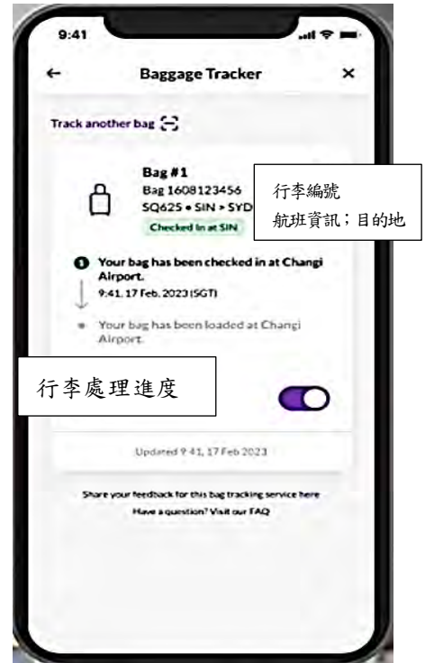
圖 3 新加坡樟宜機場提供之託運行李追蹤服務應用程式

場等影響旅客旅遊體驗情事。相較於新加坡樟宜機場考量旅客量增加情形，為利旅客掌握行李於機場內之裝載、轉運過程，協助解決行李遺失或延遲等問題，於 2022 年底參酌國際航空運輸協會 (International Air Transport Association, IATA) 第 753 號決議之服務精神，主動推出託運行李追蹤服務，供搭乘特定航空公司之旅客，透過機場 APP 掃描行李標籤條碼，即時查詢行李資訊 (圖 3)，增加行程規劃彈性；該機場並將逐步擴增參與即時查詢行李資訊服務之航空公司。經函請桃園國際機場公司研議參酌國際標竿機場實務經驗，強化資訊公開，評估於桃園國際機場 APP 或該公司網站建置個人行李運送狀態查詢功能之可行性，俾利旅客即時掌握行李訊息，提供旅客優質服務。據復：預計於 114 年辦理「出入境行李追蹤資訊共享」概念性驗證案，依出入境行李處理重要節點，提供個人行李資訊查詢，後續將依概念性驗證案執行結果，評估於桃園國際機場 APP 或公司網站建置個人行李運送狀態查詢功能之可行性。