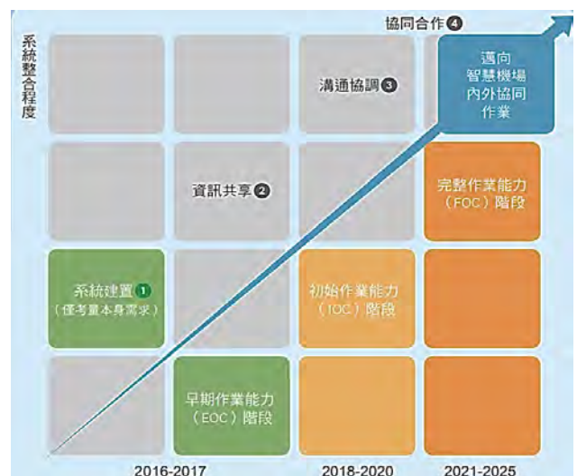
圖 1 智慧機場建置規劃藍圖

桃園國際機場公司為因應航空運輸環境之快速變遷，順應國際航空業科技智慧化潮流，將「智慧機場」列為核心發展藍圖，並於 2023 年永續報告書中，擇選「智慧機場設計」作為重大主題，依循永續性報告通用準則（下稱 GRI 準則）2021 年版等相關規範進行編撰，對外揭露其推動智慧化機場之進程。據該公司 2023 年永續報告書載述，其推動智慧機場所訂期程為 10 年（105 至 114 年，圖 1），區分短期（105 至 106 年）、中期（107 至 109 年）及長期（110 至 114 年）等階段，逐步提升機場硬體設備及優化營運軟體系統，創造旅客便捷之旅程經驗。經查，該永續報告書除敘述階段目標外，僅就藍圖六大構面、推動策略、所設推動委員會之組織架構、制定之驗證計畫及建置之部分資訊系統功能進行概述，對於各階段實際推動進度、目標達成程度及執行成效等資訊，未見具體量化指標或驗證性佐證資料，顯示其整體資訊揭露未盡透明。經函請桃園國際機場公司，檢討參酌 GRI 準則相關規範，於後續執行階段具體揭露各項目目標達成情形與執行成效，佐以量化資訊及績效指標，以增進利害關係人瞭解公司智慧治理與永續策略之績效。據復：將參酌 GRI 準則相關規範，於永續報告書揭露智慧機場發展藍圖各項目目標之達成情形與執行成效。