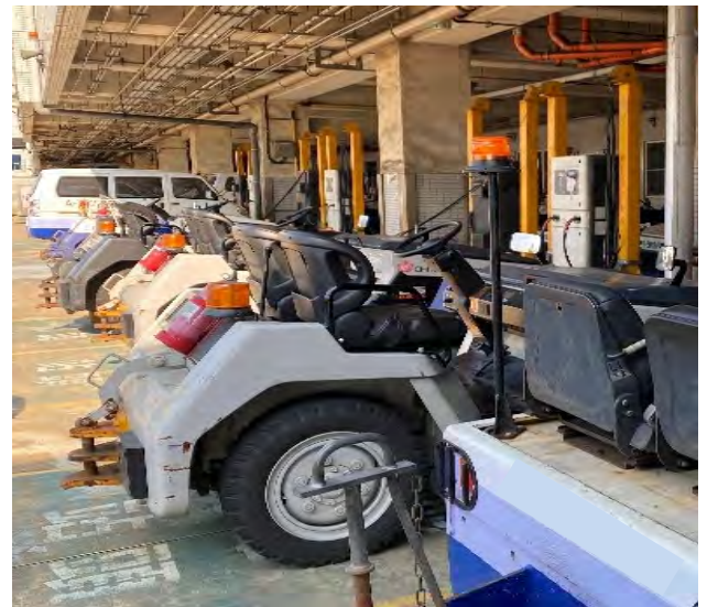
圖 4 機場空側電動車專用停車位設置情形

桃園國際機場公司為提供機場空側各駐站作業單位停放小客車、地勤裝備及油栓車等空間，於桃園國際機場機坪周圍及廊道下方共設置停車格 1,075 格，其中 384 格係供當班裝備車輛及公務機關使用，實際可供空側業者租用者僅 691 格，截至 114 年 3 月底止，658 格已出租，尚有 33 格待出租，另領有通行證之地勤車輛計 2,098 輛，惟尚未導入智慧化停車管理模式，租賃資料係由各承辦人員分散處理，缺乏系統化統整，且管理作業標準不一，致車位停放及出租狀況等資訊查詢不易，無法即時掌握停車動態；另該公司為配合政府淨零碳排策略，已於空側設置 43 座雙槍充電樁（圖 4），並輔導地勤業者換裝電動車 290 輛。惟現有充電樁未兼具快充功能，充滿電力需耗時 3 至 8 小時，相較快速充電樁僅需數十分鐘，恐難滿足地勤業者充電需求，且未訂定充電使用費率、使用時間限制及禁止非電動車使用等規範，影響管理成效。經函請桃園國際機場公司檢討空側車輛管理策略，研議導入智慧化管理模式，並完善電動車專用車位之充電設施及管理規範，以實現即時監控及動態管理，營造安全、