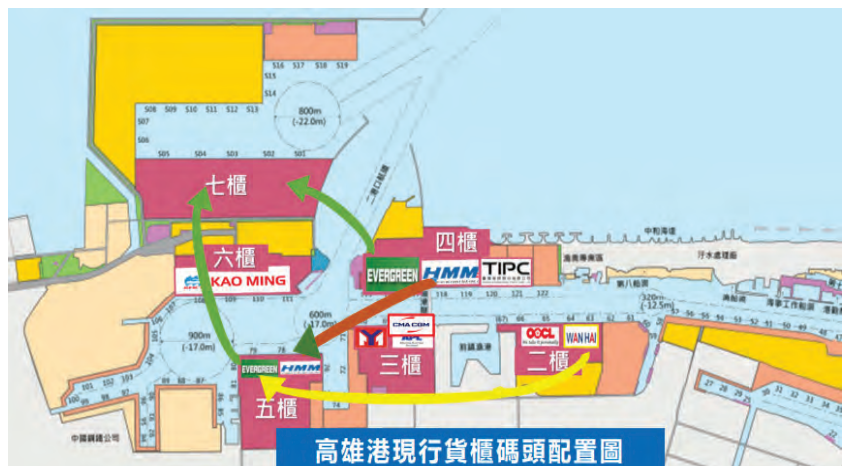
圖 2 高雄港貨櫃碼頭重新配置情形