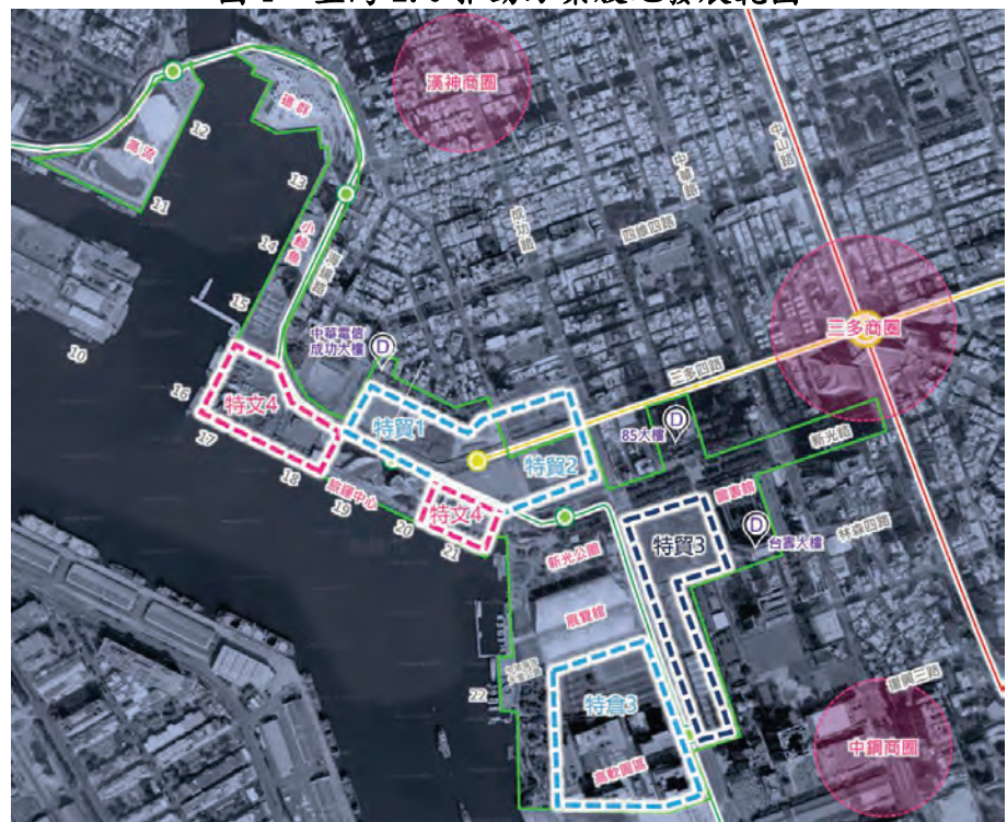
圖 1 亞灣 2.0 推動方案腹地發展範圍

「亞灣 2.0—智慧科技創新園區推動方案」（下稱亞灣 2.0 推動方案）。其中「亞灣 2.0 推動方案於擴大用地—腹地發展」推動措施，係為因應廠商進駐需求，擴大可應用腹地，規劃將臺灣港務公司經管港區內土地，包括高雄港苓雅港區第 16 至 18 號及第 21 號碼頭後線等舊港區特文四