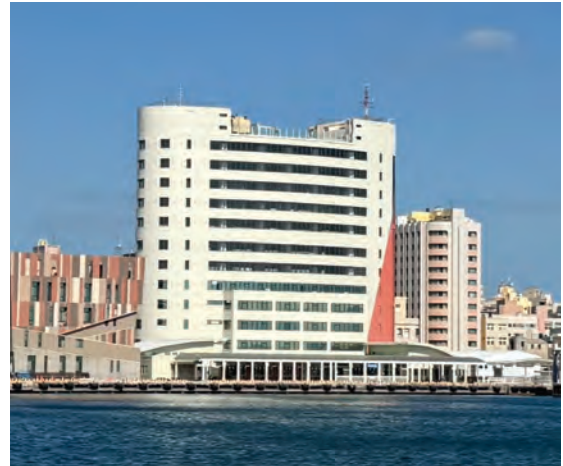
圖 3 馬公港港埠大樓

樓樓層，以經營旅館、餐飲等業務，惟上開承租廠商於租賃期間，或因積欠租金，或主動終止契約，致與高雄分公司發生租約糾紛。又高雄分公司為優化港埠大樓設施，於 106 至 108 年度及 111 年度辦理外牆整修、電梯及消防設備更新等多項工程，惟上開承租廠商以工程施作或設施未臻完善等，影響其經營為由，請求減少違約金或終止租約，除衍生訴訟成本，相關樓層亦產生閒置情形，影響財務收入。據交通部觀光署旅宿網及交通部統計查詢網資料，澎湖縣之觀光旅館、一般旅館及民宿，總家數自 110 年底之 1,122 家，增加至 113 年底之 1,360 家；又 113 年度 6 月份住用率（係全年最高）分別為 78.22%、47.42%及 40.51%，顯示澎湖縣旅宿供需情形尚未飽和，旅宿業競爭激烈；又依國內商港未來發展及建設計畫（111—115 年），已將澎湖港馬公碼頭之金龍頭觀光服務區招商作業列為澎湖港發展策略之一，規劃打造多元住宿、商業及休憩設施與景點等渡假勝地，將衝擊馬公港港埠大樓未來發展。經函請臺灣港務公司確實檢討該大樓承租廠商經營困難之癥結原因，及辦理相關整修工程前與承租廠商妥為協調溝通，並綜合考量旅遊市場動態及澎湖港發展趨勢，評估馬公港港埠大樓未來定位，研謀適切之因應策略，以有效發揮資產運用應有效益，俾利澎湖港整體發展。據復：未來港埠大樓如進行大型工程，將於設計階段即與承租廠商進行溝通及協調