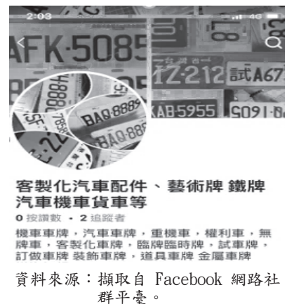
圖 2 客製化車牌推播廣告

（三）交通部訂定高齡駕駛人換照規範以降低交通事故風險，惟施行日前已滿 75 歲駕駛人得免換發駕照，形成道安管理漏洞，又換照檢測項目、換照年齡及定期換照年限等容有精進空間，允宜檢討現行高齡換照制度妥適性，以確保高齡駕駛及用路人安全。