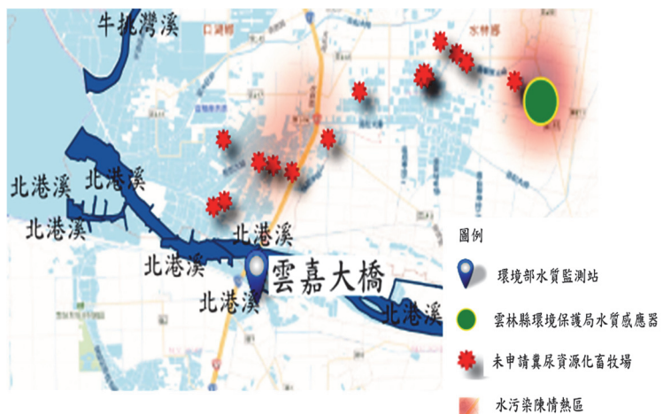
圖 4 北港河流域、水污染陳情熱區及未申請糞尿資源化畜牧場與該局水質感測器建置情形

經函請檢討改善。據復：1. 已於 114 年增購 3 臺水質感測器，並設置於重點污染熱區，且將結合地理資訊系統與許可管制等資料，持續運用 AI 人工智慧判定水質污染高強度熱區，以發揮水質感測器效益；2. 加強宣導水污染防治措施及檢測申報管理辦法修正事項；3. 截至 113 年 12 月 24 日止，中小型畜牧場之糞尿資源化比率