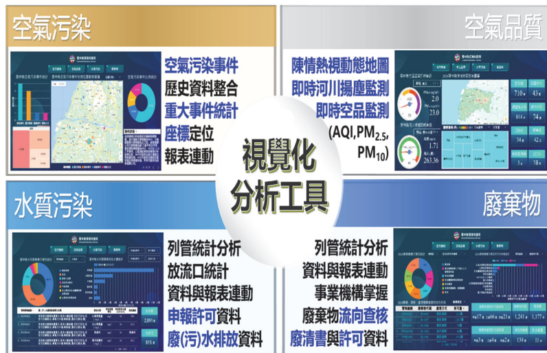
圖 3 雲林縣環境智慧決策支援系統 (YES 系統)

港溪等主要河川污染程度加劇，允宜加強宣導 114 年 1 月 20 日修正施行之水污染防治措施及檢測申報管理辦法之內容，舉如：畜牧業將畜牧糞尿水全量委託畜牧糞尿或生質能資源化處理中心，或資源化處理比率達 75% 以上畜牧業處理，經主管機核准者，免辦理檢測申報，以鼓勵畜牧業者更積極參與資源化處理措施，減少河