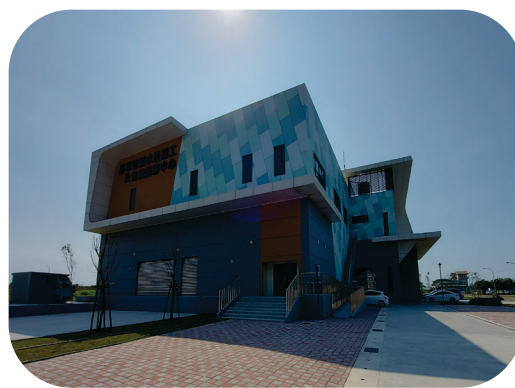
將軍智慧水產加工及物流運籌中心 智慧水產示範基地興建工程

設備停產而停工辦理變更設計，耽擱執行進度；2. 後續擴充之履約保證金或建築師工程師專業責任險，廠商尚未繳交或展延保險期限；3. 施工預定進度未確實登載於標案管理系統；4. 部分工程項目施作與契約圖說規範未符等情事，經函請檢討改善。據復：1. 已於114年5月完成變更設計議價程序，並請廠商進場施工，將於施作完成後，移交OT廠商營運；2. 已函請廠商補繳後續擴充履約保證金317萬餘元，另建築師工程師專業責任險保險期限已展延至115年3月；3. 已於公共工程雲端服務網確認及修正施工預定進度；4. 已依契約或設計圖說改善，並辦理工程督導，以提升工程品質。