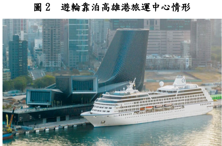
圖 2 遊輪靠泊高雄港旅運中心情形

臺灣港務公司配合交通部高雄港客運專區建設計畫興建高雄港旅運中心(圖2)，以改善客運設施及提供旅客便捷舒適之旅運空間，並提升高雄港國際門戶形象，該旅運中心建築工程於112年底完工，實際建置總經費51億1,024萬餘元。依該計畫規劃報告書載列，旅運中心經濟效益包括員工進駐節省之公務往返旅行時間與成本(預估每年節省成本436萬餘元至774萬餘元)，及旅客