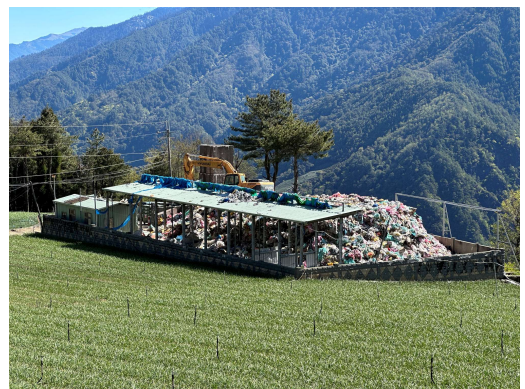
圖 5 和平區垃圾暫置場情況