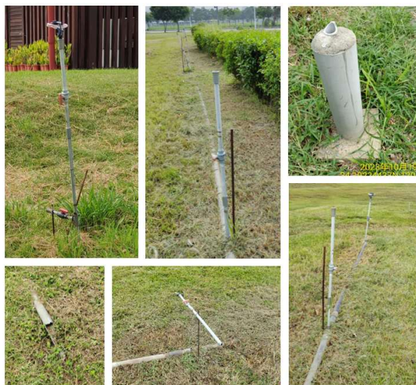
圖 1 噴灌系統固定鐵條外露及管線破損

日、2024 跨年演唱會、2023 及 2024 中臺灣元宵燈會等多場大型活動，成為市民主要休閒遊憩場所，並帶動區域觀光與發展。經查養護工程處管理維護中央公園情形，核有：1. 園區內遊客中心、管理中心，面積超逾建築物公共安全檢查簽證及申報辦法規定，自啟用後尚未辦理申報；2. 既有噴灌系統未列財產帳且部分系統毀損無法發揮功能，未積極清查毀損狀況並修復；3. 加強噴灌系統採明管方式布設且多處固定鐵條外露及破損管線未清除等(圖 1)，易危及遊客安全；4. 木製搖椅螺絲鬆脫，致座椅接合處脫落，且木製爬梯曾多次螺絲鬆脫有重新固定痕跡，允宜注意清查木製遊具接合固定安全性加以改善，以免民眾受傷；5. 園區優化工程結算項目中之變速加壓泵浦未施作即驗收等情事，經函請檢討改善。據復：1. 已於 112 年 11 月完成消防安全設備檢修及申報，並於 113 年 3 月完成公共安全檢查申報，嗣後將注意依規定定期辦理；2. 將依規定列帳，並清查各區噴灌系統無法使用之根本損壞原因，據以評估維修費用及改善方式；3. 將先行於人潮與活動較多之區域辦理管線下地，以維民眾安全；4. 已加強全面巡視木製設施，如有損壞即派工修繕並調整接合方式；5. 施工廠商已繳回工項費用，並扣罰施工及監造廠商。