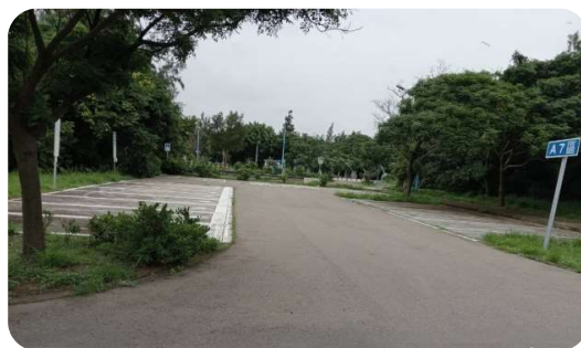
公 69 停車場