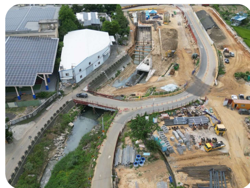
西屯區市政路開闢工程施工情形

分別於 110 年 11 月 17 日及 111 年 8 月 5 日完成發包，決標金額 5 億 7,638 萬元及 7 億 8,800 萬元。經查執行情形，核有：1. 規劃設計溫寮溪道路工程期間，未依公共工程生態檢核機制規定辦理生態調查及與生態團體溝通整合意見，肇致工程決標後，無法開工，經補辦生態調查及完成調整方案後，仍未辦理說明會，影響施工期程達 1 年 2 個月餘；2. 溫寮溪道路工程因流標而增加經費，惟未待中央補助機關核定，即先行完成發包決標，肇致中央以程