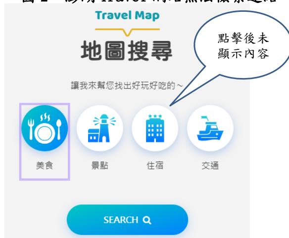
圖 2 澎湖 Travel 網站無法檢索連結