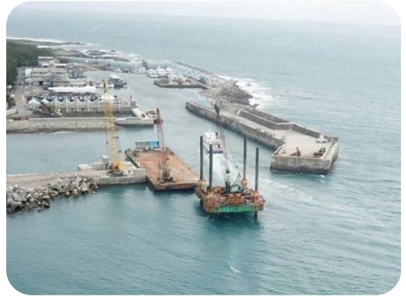
富岡漁港災後復建工程

縣政府為修復104及105年間蘇迪勒與莫蘭蒂颱風造成之富岡漁港防波堤損壞，經行政院於104至107年間陸續核定富岡漁港災後復建工程總經費3億5,352萬餘元，工程拆分為2個標案，富岡漁港災後復建工程(第1標)於108年5月9日驗收合格，結算金額1億2,864萬餘元，富岡漁港災後復建工程(第2標)於108年4月24日決標，決標金額2億185萬元，工期480日曆天，於同年6月6日開工，預定於109年9月27日完工；另為修復105年莫蘭蒂颱風造成之綠島漁港防波堤損壞，經行政院於106年11月9日核定工程復建經費4億300萬元，「臺東縣綠島漁港南防波堤堤頭復建工程」於107年8月21日決標，決標金額3億7,800萬元，工期450工作天，於同年9月18日開工，預定109年7月8日完工。經查其執行情形，核有：1. 富岡漁港復建工程施工廠