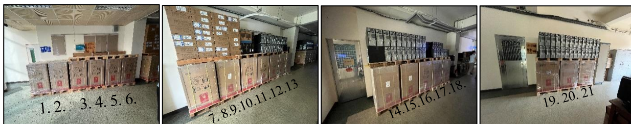
建國高中經管充電車未開封使用

1. 建國高中於 108 年至 111 年間陸續自購或獲配（租賃）充電車共 39 臺，惟截至 112 年 11 月 9 日止仍有逾半數設備未拆封使用亦未申請釋出，肇致新購（租賃）財產長期間置：教育局為促進電腦資訊設備資源有效運用，曾於 109 年 6 月 1 日函知所屬學校，有關各校運用中央「109 年度一般性補助款指定辦理施政項目－電腦資訊設備更新案」經費，購置個人電腦、行動載具及充電車，倘各校因校內資訊設備已足夠，擬部分或全部釋出本案核定資訊設備者，應於 109 年 6 月 12 日前通報該局，該局將另行撥予其他設備不足學校，以利資源分配公平合理。經查臺北市立建國高中於 108 年 12 月至 111 年 7 月間陸續接收教育局配發（租賃）或自行購置充電車共 39 臺，經本處於 112 年 11 月 9 日實地勘察使用情形，發現其中有 12 臺租賃充電車自 108 年 12 月 23 日租賃日起至 112 年 2 月底租賃期滿（計 3 年 2 個月餘）全數未曾使用，虛擲公帑 43 萬餘元；另有 9 臺充電車（採購總值 41 萬餘元）自 111 年 7 月獲配或 109 年 9 月自行購入後均未拆封使用，已閒置 1 年 3 個月及 3 年 1 個月，逾該等設備使用年限（5 年及 8 年）4 分之 1 以上，仍未檢討通報教育局調撥他校使用，以充分發揮該等設備購置效益等情事，經函請督促檢討妥處。據復：將於 113 年 7 月 31 日前將前開 21 臺未拆封閒置充電車調配至有需求學校，未來若有統一購置或租賃設備專案，擬於契約規範內設定定期實地巡檢機制，以有效管理及提升設備使用率，並將該設備納入該局例行性抽測項目，避免類似缺失再度發生。