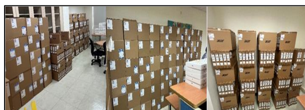
教育局置放臺北市立三興國小之載具未拆封使用

(二) 教育局及所屬學校經管數位學習設備，間有管理未臻周妥，或購置後長期閒置等情事，有待督促檢討改善。