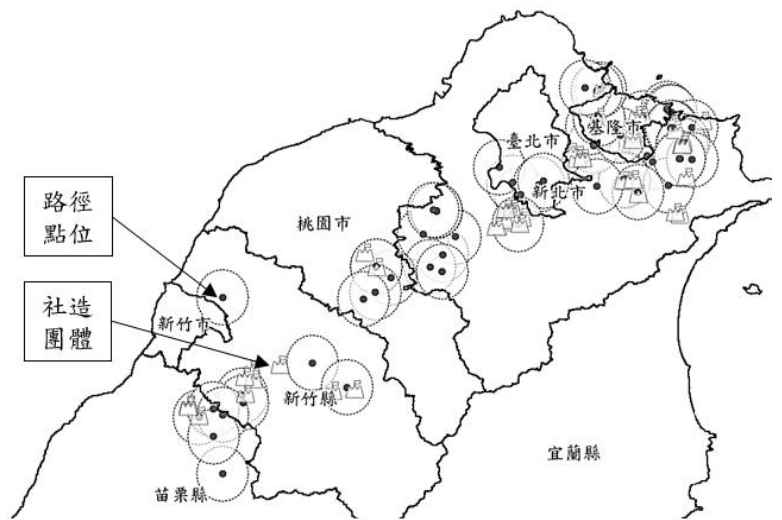
圖 2 文化路徑點位與社造團體分布—以礦業路徑為例

2. 臺灣試行 5 條文化路徑尚有多處社區營造團體迄未完成盤點，允宜加強辦理，以凝聚地方共識及民間參與能量： 文資局參考歐洲文化路徑之推動模式，透過文化場域盤點分級，將兼具文化歷史重要價值、旅客服務功能及有意願合作之場域指認為「錨點」，以及未達錨點標準但可與其相關有形無形文化資產串聯形成有意義故事之場域指認為「場所點」，依據錨點及場所點產生各種「路徑」，發展出兼具文化代表性、旅遊服務機制及串聯周邊功能之文化路徑營運系統。又依臺灣文化路徑推動社會發展計畫載述，文化路徑之推動有賴在地化之營運組織，始能由下而上系統性蒐集地方知識，深化臺灣文化路徑知識體系，因此規劃透過倡議擾動及組織串聯，擴大民間參與能量，包括地方文史團體、部落團體、地方組織等之參與。為瞭解臺灣試行 5 條文化路徑納入在地社區營造組織，辦理在地組織串聯情形，經依文化部提供之 110 至 112 年度各市縣社區營造及村落補助計畫資料庫之獲補助對象（下稱社造團體）基本資料，將社造團體之地址轉換成座標，運用地理資訊系統 (QGIS) 繪製全臺社造團體分布圖，再以文資局提供截至 112 年 11 月底止之礦業、糖業、林業、水文化及臺灣多元族群等 5 條臺灣試行文化路徑點位（錨點或場所點）座標，套疊各試行文化路徑點位半徑 5 公里內之社造團體（圖 2），分析結果：位於礦業、糖業、林業、水文化及臺灣多元族群等 5 條文化路徑上之社造團體分別有 21 處、6 處、13 處、6 處、7 處，文資局及臺史博已完成盤點之團體分別有 2 處、1 處、