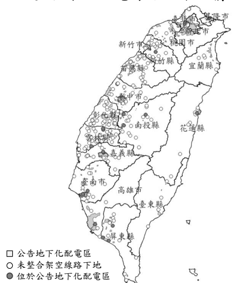
圖 1 110 至 112 年度受補助案件未整合架空配電線路地下化情形

內政部為提升道路品質，研提「提升道路品質計畫」，經行政院於106年6月7日核定，實施期程為106年9月至110年8月，經費計212億元；嗣該部修正上開計畫為「提升道路品質計畫2.0」，經行政院於109年8月28日核定，實施期程為106年9月至114年8月，其中110至114年度經費計269億餘元，用以補助直轄市、縣(市)政府改善重點發展之道路，主要工作項目包含共同管(線)溝整合與建置等，期節省不必要或重複性開挖與填補道路之經費支出，改善道路服務品質。經查執行情形，核有：1. 該部於81年5月5日推動市區道路電線電纜地下化建設計畫，訂定「市區道路電線電纜地下化建設規範」(下稱電線電纜地下化建設規範)，嗣該部為推動提升道路品質計畫2.0，訂有提升道路品質計畫2.0補助執行要點，規定受補助機關之補助案件工程設計應依循「市區道路及附屬工程設計規範」辦理，其中管線工程配置原則須符電線電纜地下化建設規範等相關規定，惟上開建設規範實施已逾32年餘未修正，部分條文已不符時宜；2. 該部辦理提升道路品質計畫2.0，刪除提升道路品質計畫所定有關辦理共同管(線)溝之直轄市政府增加補助5%，縣市政府部分則增加補助10%之規定，及刪除管線下地長度之關鍵績效指標，影響受補助機關執行共同管(線)溝整合與建置意願；且刪除上開關鍵績效指標後，未廣續統計受補助機關執行管線下地長度，無法有效掌握受補助機關實際執行成效；3. 經本部運用 QGIS 地理資訊系統將台灣電力公司公告實施地下化配電區範圍，與110至112年度受補助改善道路品質工程採購案(計417件)之工址進行圖層套疊結果(圖1)，工址路段上存有既有架空配電線路未整併下地者計233件，其中計有18件施作工程位於台灣電力公司已公告實施之地下配電區，相關案件受補助機關未能提早與台灣電力公司溝通協調整合架空配電線路下地，該部亦未能有效督促受補助機關配合執行共同管