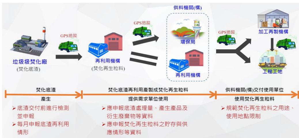
圖 2 焚化再生粒料流向管制

於 109 年 11 月 27 日訂定「臺北市焚化再生粒料推廣使用作業要點」，明定轄內公共工程使用控制性低強度回填材料（下稱 CLSM）者，應使用臺北