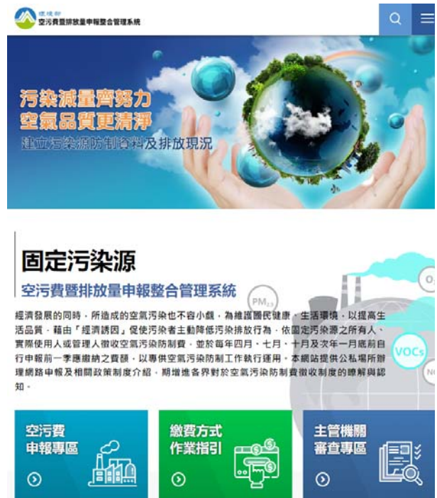
圖 1 空污費暨排放量申報整合管理系統

（五）積極推動南投縣低碳永續家園建構工作及補助民眾汰舊換新購置電動機車，惟未均衡推動六大面向措施或僅 6 成村里參與低碳永續家園評等及升等，且南投縣純電能機車占比仍未達百分之二，允宜檢討改善。