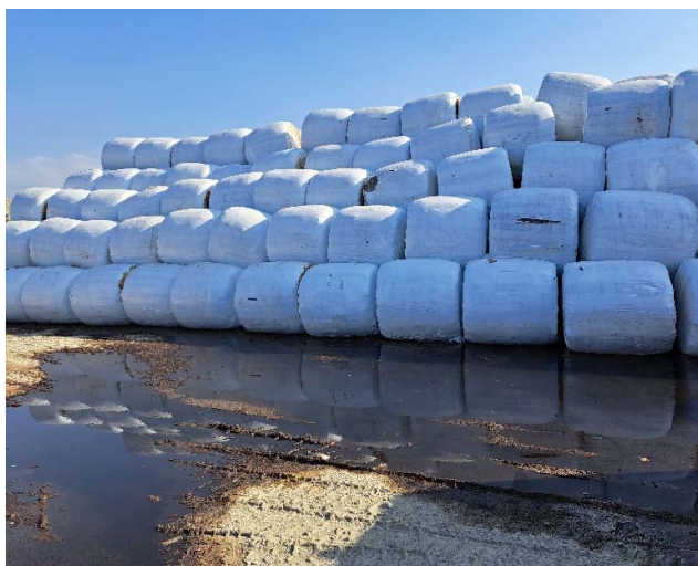
垃圾打包物暫置地

為檢討改進；4. 草屯鎮小型焚化廠報廢拆除計畫執行進度落後，允宜積極執行，並按拆除後土地規劃用途，妥為檢討興辦事業計畫書及土地撥用計畫內容修正之必要性；5. 草屯鎮清潔隊及未來垃圾轉運站或處理場所地點之遷移規劃及現址之環境管理維護，亟待積極協助處理等情事，經函請檢討改善。據復：1. 計畫執行前期因烏嘴潭工程堆置賸餘土方造成擠壓打包物暫存空間，進而影響打包進度未能如期進行，已暫時解決暫置