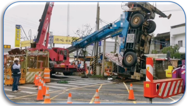
捷運 GC01 工程吊車翻覆

全衛生管理情形，核有：1. GC01 標工程負責捷運綠線高架段施工，經常使用起重機辦理吊掛作業，惟發生 5 件工安意外係與吊掛作業之操作疏失有關，並導致 1 死 4 傷，甚至有 2 件造成起重機翻覆事故等，其發生原因係起重機作業範圍地面不穩固、未禁止人員進入有發生碰撞危害之作業範圍內，及操作人員未依規定回訓等，核與起重機相關作業安全規定未符。又屢遭民眾檢舉吊車吊臂越過圍籬至道路範圍，造成民眾曝露在吊臂下方通行安全之虞；2. 本工程於 110 年 4 月 25 日至 111 年 4 月 20