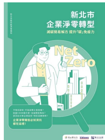
碳健檢中心宣傳海報

經濟發展局為達到市政府訂定 2050 淨零排放目標，於 110 及 111 年度輔導轄內能源用戶節能，並邀請專家學者實地查核大型或中小型能源用戶節能效益及提供建議改善意見，並委託國立臺北科技大學數位科技轉型研究中心分析查核輔導作業整體成果，總經費計 116 萬餘元；續於 112 年度辦理「產業能效提升計畫」委託專業服務案，契約金額 425 萬元，協助工業及服務業能源用戶瞭解其營業場所用電情況，改善能效較低設備；另於 112 年 6 月 5 日成立「新北 Net Zero 碳健檢中心」（下稱碳健檢中心），提供企業碳健檢諮詢服務。經查各項節電輔導措施執行情形，核有：1. 依據產業能效提升計畫擇選年節電率未達 1% 之工業及服務業能源大戶業者進行查核輔導，111 年及 112 年累計輔導 59 家，占目標家數 72 家之 81.94%，惟尚未依據計畫內容擇選產業用電指標（Energy Usage Intensity，EUI），超過平均值之業者為查核輔導對象；2. 邀請專家學者針對能源用戶辦理節能輔導查核並提供建議，惟未追蹤各項建議執行情形及其節能成效；3. 經統計主動向碳健檢中心諮詢之企業，多屬有意願瞭解碳議題與執行減碳之中小型能源用戶，允宜研酌運用碳健檢中心所