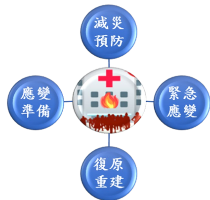
圖 2 醫院及長照機構火災應變規劃

臺灣永續發展核心目標 11 之具體目標 11.5 揭示：「降低各種災害造成的損失，特別需保護弱勢與低所得族群。」消防局為落實辦理各類場所消防安全檢查工作（下稱消防安檢），以維護公共安全，運用消防署建置「消防安全檢查列管系統」（下稱安管系統），列管消防安全檢查事務，截至 113 年 4 月底止，列管場所計 2 萬 7,371 家，為提升火災預防能力，確保緊急情況有效疏散患者及保護醫療設備（圖 2），於 112 年 3 月訂定醫院、老福及護理等相關場所消防安全檢查專案執行計畫，經查執行情形，核有：(1) 該局檢查範圍係以安管系統列管 379 家醫院或長期照顧服務機構（下稱長照機構），惟經運用安管系統篩選甲類及乙類第 6 目場所分別計 553 家及 103 家，與衛生局公開於政府資料開放平臺市轄 127 家社區式服務類長照機構明細勾稽發現，計 8 家長照機構未納列於安管系統，形成安檢漏洞；(2) 部分活動中心或寺廟內設有長照機構，惟安管系統用途別仍列為建物原用途，致未列入專案計畫檢查對象等情事，