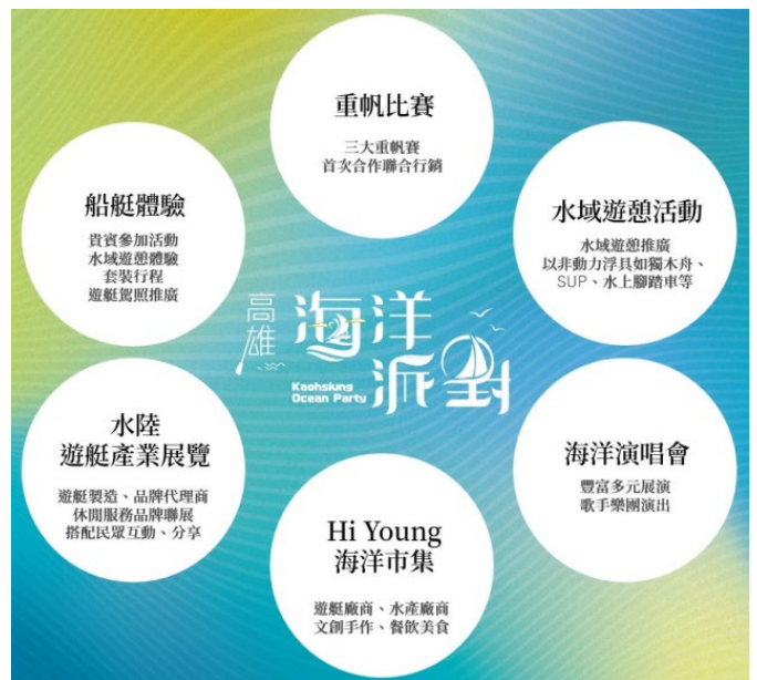
圖 3 海洋派對 6 大核心活動

海洋派對委託案，預算金額 1,477 萬餘元(含契約變更金額，中央補助 1,240 萬元)，於愛河灣辦理遊艇展覽、乘船體驗、海洋市集、水域遊憩活動等，以型塑全民親近海洋、保護海洋、擁抱海洋生活之氛圍(圖 3)。經查辦理情形，核有：(1) 辦理船艇參觀活動，部分參展帆船未常駐停泊於展示水域，與需求書規定未合；(2) 各項活動允宜儘早規劃通盤考量，配合主要活動期程辦理，以促進更多民眾參與；(3) 活動結束尚乏整體成效分析，不利評估計畫執行效益，尚待研酌改善等情事，經函請檢討改善。據復：(1) 未來辦理類似委託案，將敘明船艇數量、尺寸及停泊時間等需求以利檢核；(2) 未來辦理大型活動將及早通盤考量整體規劃，並配合活動期程辦理相關宣傳及互動體驗，提高民眾參與度，以增加計畫執行效益；(3) 未來將納入參與業者及民眾之屬性分析、滿意度調查、建議回饋等質化量化指標，分析辦理效益及目標族群參與成效，以利未來推動遊艇產業、海洋休憩觀光產業等政策及行銷推廣活動參考。