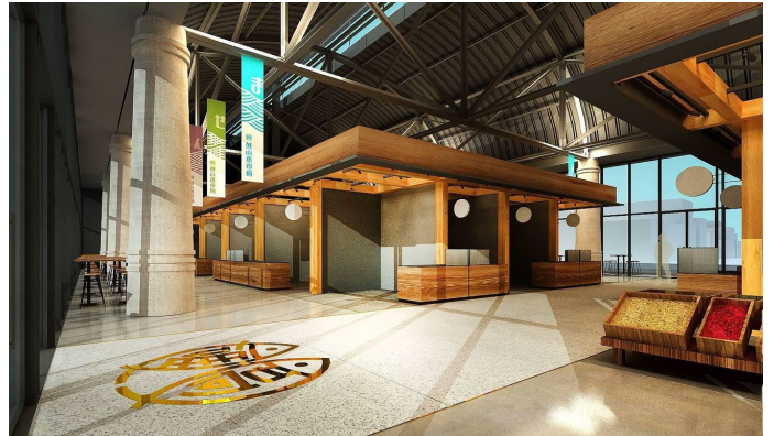
圖 1 鼓山魚市場整建保留既有結構情形

為「高雄農漁精品展售中心」，並榮獲英國 2023「London Design Awards」鉑金首獎殊榮。111 年 7 月委外經營管理，規劃餐飲、農漁精品展售空間，嗣因人潮不再自 112 年 4 月起暫停營業，調整櫃位，於同年 12 月 15 日重新營業。經查辦理情形，核有：(1) 為活化頹廢老舊鼓山魚市場，投入鉅資改建，