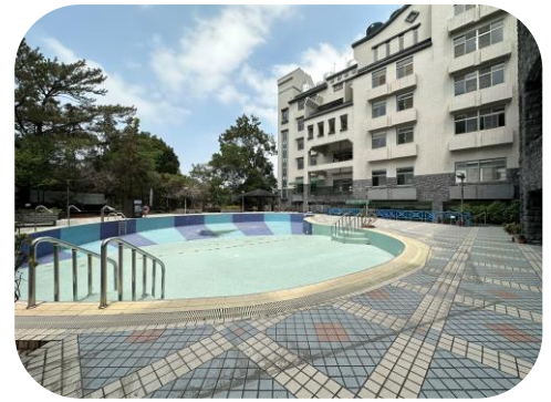
關子嶺勞工育樂中心

該局自 92 年 1 月 1 日起，將關子嶺勞工育樂中心依促進民間參與公共建設法（下稱促參法）規定委託統茂大飯店股份有限公司經營管理。因委託經營期限屆至，且為改善該勞工育樂中心既有空間軟硬體設施並有效提升服務品質，復依據促參法於 111 年 11 月 17 日與村野大飯店股份有限公司（下稱村野公司）簽訂「臺南市關子嶺勞工育樂中心營運移轉案－投資契約」，以 OT 方式委託予村野公司營運，並於 112 年 3 月 1 日完成資產點交，營運期間自點