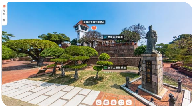
臺南旅遊網沉浸式體驗服務畫面

該局為推廣臺南市觀光旅遊，提升旅遊資訊取得便利性及服務效能，建置「台南旅遊網」網站及「旅行台南」行動應用軟體（Mobile Application，APP），並於 111 年 8 月完成臺南旅遊網維護營運暨功能擴充及旅行臺南 APP 整合建置（合約金額 290 萬元），提升及優化網站與 APP 功能，其中臺南旅遊網，111 年度截至 9 月止瀏覽量計 189 萬餘次，而旅行臺南 APP，自 102 年 4 月至 111 年 9 月止下載量已達 16 萬餘次。經查其建置及相關管理維護情形，核有：1. 臺南旅遊網雖設有問卷調查專區，惟僅針對觀光活動進行意見調查，尚未有使用者對於網站提供資訊及相關功能之滿意度調查，不利快速回應民意，以提供符合使用需求之網站服務；2. 因應國際化虛擬旅遊趨勢，臺南旅遊網已建置沉浸式體驗服務，運用多媒體素材建立虛擬旅遊導覽，並透過攝影機步行運鏡方式，使遊客彷彿置身現地，惟截至 111 年 9 月底止，僅提供安平古堡、安平樹屋、安平老街、大魚的祝福及河樂廣場等 5 處觀光景點，且集中於安平區；3. 臺南旅遊網及旅行臺南 APP 提供旅遊景點、住宿及美食購物等諸多資訊，惟部分資訊未完整（如未提供商家營業時間），或未即時更新資訊（如商家已暫停營業惟未更新資訊），不利民眾查詢使用；4. 臺南旅遊網及旅行臺南 APP 已提供進階搜尋及關鍵字等功能，惟旅行臺南 APP 提供之搜尋篩選條件功能相對不足；又全球穆斯林人口眾多，相關旅遊市場頗具開發潛力，臺南市已有多家餐館取得穆斯林友善認證，惟臺南旅遊網及旅行臺南 APP 進階搜尋功能，尚未提供穆斯林友善觀光場域及餐飲認證等選項；5. 政府推動新南向政策，東南亞國家來臺旅客攀升，惟臺南旅遊網及旅行臺南 APP，僅提供繁體中文、簡體中文、英文、日文及韓語等 5 種語言介面，尚無東南亞國家語言等情事，經函請檢討改善。據復：1. 已請臺南旅遊網網站廠商建置滿意度調查功能，以作為後續優化網站參考；2. 將視民眾問卷調查反映，爭取經費擴增臺南旅遊網沉浸式體驗服務，或評估與其他機關建置之臺南市景點沉浸