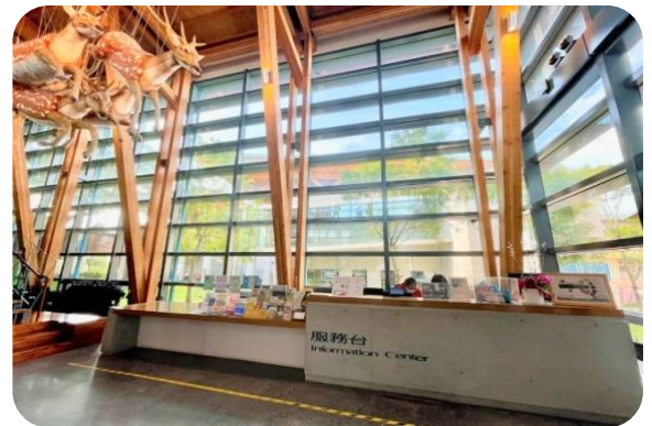
左鎮化石園區旅服中心及園區服務臺

臺南市觀光旅遊興盛，該局為營造友善環境及提升服務品質，於臺南火車站、新營火車站、高鐵臺南站及臺南航空站等 4 處交通場站，左鎮化石園區、德元埤風景區、虎頭埤風景區等 3 處觀光園區，及安平、無米樂、月之美術館、原合同廳舍等 4 處觀光熱點，共設置 11 處旅遊服務中心（下稱旅服中心），並進用 24 名人員提供服務諮詢；又為提供遊客綿密、多元、即時之旅遊諮詢服務，與市內商家協力設置問路店，庶期打造民間版