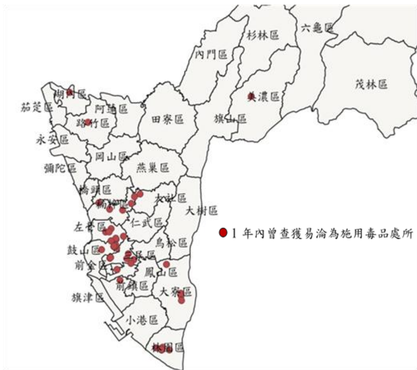
圖 3 111 年度高雄市列管涉毒熱點

警察局為配合修正新世代反毒策略行動綱領（第二期 110 至 113 年），落實溯源斷根之緝毒工作，加強清查轄區內易淪為毒品施用、交易之熱區、熱點或其他特定營業場所，並與學生校外生活輔導會合作建立涉毒案件熱點巡邏網，截至 111 年底止，列管 82 處涉毒熱點及區域，集中於三民、左營、鼓山及楠梓等行政區（圖 3），惟同年度相關媒體刊載尚有鳳山、小港及甲仙等行政區經查獲毒品卻未納管，又列管校園周邊少年易聚集滋事、施用或販賣毒品之 173 處場所相關資訊，係以表格方式呈現，不易察覺其關聯性，且部分場所存有無法辨識地理位置等情，鑑於運用地理資訊系統（Geographic Information System, GIS），以地圖視覺化