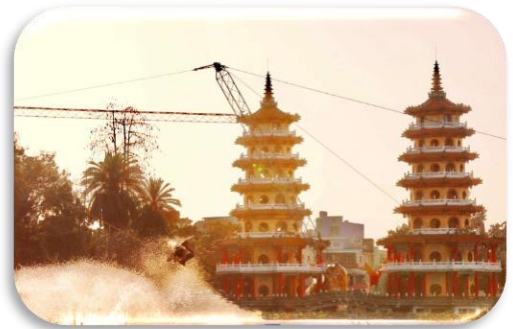
蓮池潭纜繩滑水場域

市政府為響應行政院「向海致敬」政策，宣示水域解嚴，並配合「還河於民」等政策，自 109 年度起陸續開放遊憩水域，迄 111 年底，由觀光局轄管已開放遊憩水域計有愛河、旗津海水浴場及蓮池潭等 3 處。經查其辦理情形，核有：(1) 愛河及旗津海水浴場於開放水域遊憩活動前，皆委託專家學者評估規劃，惟蓮池潭遲未辦理開放前評估，不利掌握水域環境特性，又據媒體報