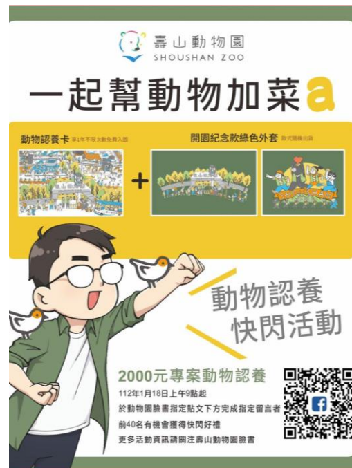
圖 2 動物認養快閃活動圖卡

福祉之支出偏低，允待檢討研議認養收入資源之運用方式及衡酌運用滿意度調查分析遊客回饋意見，以作為持續優化營運之改善方向參考；(2) 部分圈養動物未明原因死亡，允待研酌運用科技設備以輔助園區照顧人力之不足，並強化動物醫療設備(施)，以即時掌握動物活動狀態等情事，經函請檢討改善。據復：(1) 持續爭取民間及企業參加動物認養計畫，以更新園內動物展