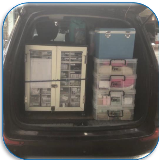
復興區衛生所巡迴醫療車