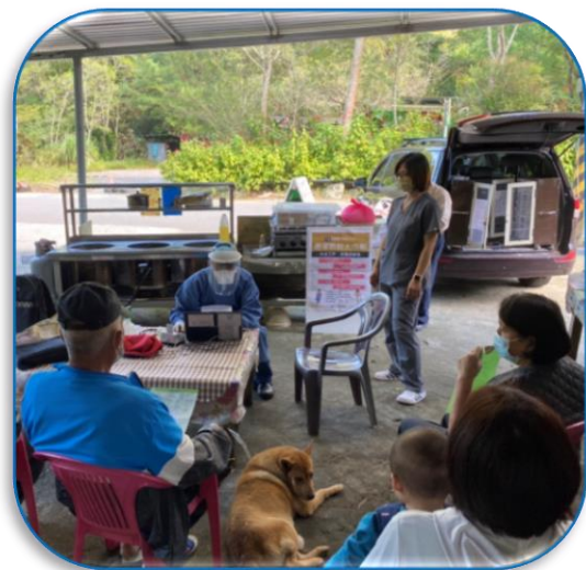
復興區長興里高遠部落戶外診療情形