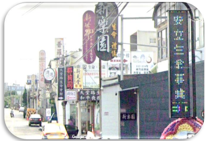
中壢區殯儀館周圍民間會館林立情形

市政府為規範殯葬設施、服務行為，提升市民生活品質，制定桃園市殯葬管理自治條例，由殯葬管理所執行違法之查報，民政局執行違法之裁處，106 至 111 年度合計裁罰 142 次，罰鍰總額 971 萬餘元。經查其管理情形，核有：(1) 桃園區及中壢區殯儀館周圍民間會館林立，尤以中壢區培英路設立會館密度最高，有同一地址設置 5 家殯葬禮儀服務業者情形，另據民政局提供違反殯葬管理條例規定之罰鍰資料分析結果，其中連續 5 年違法提供非法殯葬設施供民眾使用者，計有通○