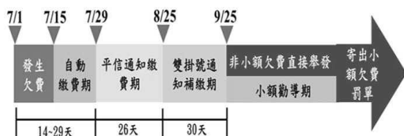
圖3 國道高速公路通行費欠費催繳流程圖

2. 通行費欠費之清理成效有限，尚待研謀改善機制，以落實使用者付費原則： 自民國103年度起，收費方式由舊有依通過收費站收取通行費（計次收費），改採全面電子計程收費。高公局考量收費制度之改變，為使用路人有足夠時間繳費，通行費欠費係按日歸戶，每半個月採書面通知催繳，其催繳程序係先以平信通知限期繳費，如逾期未繳費者，再以雙掛號信通知（圖3）。經查民國103年度由計