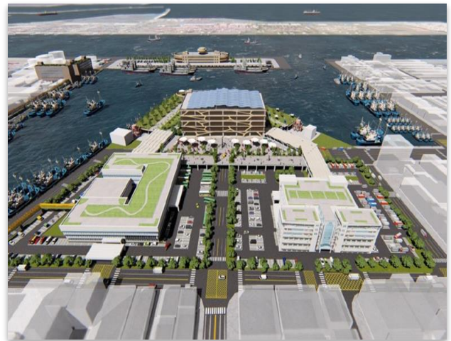
圖 4 前鎮漁港規劃願景

覈實；6. 廠商累計完成數量經伸算已超過當年度可用預算額度，恐影響工程後續之估驗計價，允宜籌謀因應；7. 品管費用及材料設備檢驗費用未依工程規模及性質妥為編列；8. 重要工項未訂定檢驗方式，且部分材料工項尺寸、規格或配置未明確訂定；9. 監造單位未覈實填寫監造報表；10. 履約保證金連帶保證書有效期限不足；11. 營造綜合保險單未將設計及監造廠商列為共同被保險人，且部分工項未納列保險範圍等情事，經函請檢討改善。據復：1. 施工不符處均改善及修正；2. 契約設計圖說所載材料試驗內容誤植已更正，將針對已完成部分鑽心取樣進行試驗，如發現不符依契約規定改善及扣罰；3. 已依契約規定扣罰監造單位及施工廠商；4. 設計監造單位已