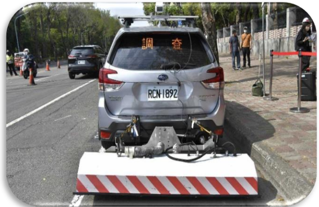
透地雷達檢測作業情形

110 年度編列預算 21 億 3,478 萬餘元（含中央前瞻基礎建設計畫經費補助 7 億 6,958 萬餘元），辦理道路平整及養護工作，刨鋪瀝青混凝土路面計 564 條道路路段，改善總面積約 260 萬平方公尺。經查其辦理情形，核有：1. 推動道路自動化巡查作業，可提升道路巡查及修補效率並降低道路巡查人員工作危害風險，惟 AI 自動辨識鋪面狀況準確性有待評估及強化，允宜持續檢討及精進使用；2. 道路或人行道採用透水鋪面，有助於減輕排水系統負擔，並強化地下水資源之涵養，允宜加強推動，促進環境永續經營；3. 部分新闢道路之寬度線形等圖層資料尚未匯入道路挖掘管理系統，不利施工前道路挖掘協調整合及道路禁挖匡列管制作業，允宜檢討研謀改善；4. 道路標線施工及檢驗規範未臻周全，間有熱處理聚酯標線抗滑係數不符交通局函示規定，漏訂定檢驗規範等；5. 高雄市市區道路管理自治條例修訂迄未報經中央主管機關完成備查，允宜協同相關機關就問題癥結共謀解決方案，以完備道路維護管理法制等情事，經函請檢討改善。據復：1. 111 年度委由具專業 AI 影像自動化辨識技術廠商協助辦理，可提升影像辨識系統準確率，並與養護工程處之養護資訊管理系統連結，建立道路巡查成果資