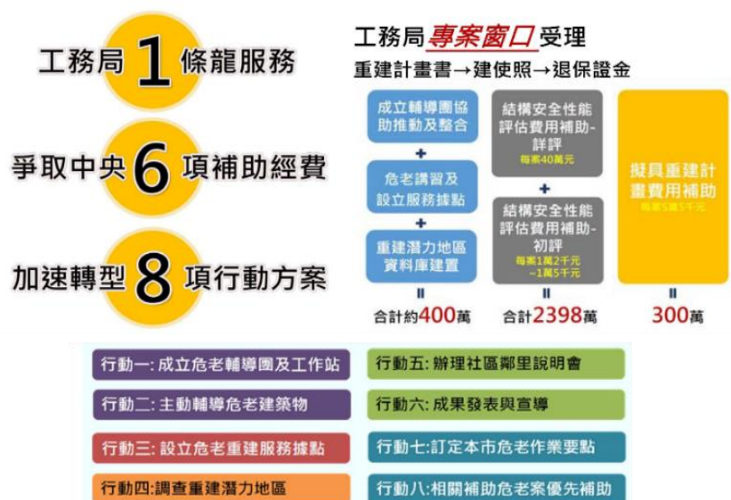
圖 3 高雄危老 168 興革制度

老舊複合式大樓逃生避難設施阻礙排除作業間有不合格情形，雖已列管督促改善，惟嗣後仍有再次設置疑慮，允宜建立不定期複查及檢討加重相關罰責機制，以降低重大災害發生風險；2. 近年曾發生火災、或鄰近 50 公尺設有加油站之高風險老舊複合式大樓，允宜優先輔導危老重建，以保障民眾生命財產安全；3. 委託專業廠商提供民間申辦危老建築重建諮詢服務，惟部分專案人員未依契約規定進駐履約，建築專業從業人員資料未報機