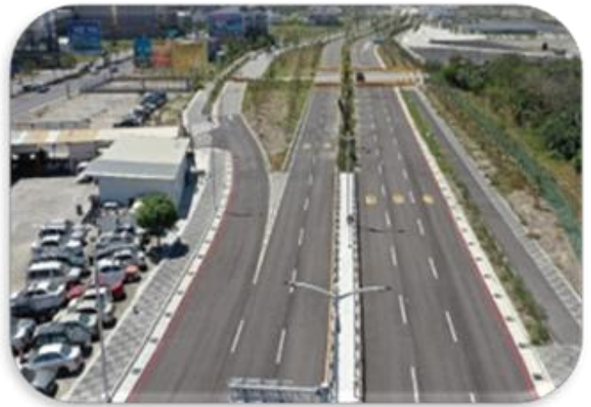
高雄濱海聯外道路北段

新建工程處考量台 17 線穿越左營、楠梓老舊社區，道路彎曲狹窄及多橫交路口，形成交通瓶頸，規劃於台 17 線西側設置北起橋頭區典昌路，南至左營區南門圓環之南北向濱海聯外道路，全長約 7 公里，期紓解地區車流，並帶動大高雄沿海地區產業及觀光發展。該聯外道路分南、北段規劃開闢，北段道路長度 2.1 公里，分 2 期施工，第 1 期工程於 110 年 5 月竣工、第 2 期工程於 108 年 12 月決標，契約金額 1 億 5,579 萬餘元。經查其辦理情形，核有：1. 部分施工與契約設計圖規定不符；2. 工程契約設計圖、數量計算及施工規範部分內容不符規定或不一致；3. 工程需土數量逾一定規模，未依規定於規劃設計階段上網申報土方交換資訊，迄開工後始尋求撮合交換機會，亦未覈實評估交換土壤性質，嗣土方進場施作後因土質變異性過大而停止交換作業，改以外購土方因應，耗費作業時程，影響工進；4. 配合現地狀況，外購回填土方，惟所需經費無著，未能完成變更設計作業，允宜積極籌措經費，以完備契約變更作業；5. 工程採購採最有利標評選，未依規定將企業社會責任指標，如鼓勵企業加薪，保障廠商員工權益等納為評選項目；6. 工程契約之結算及保固條文內容未參採行政院公共工程委員會（下稱工程會）之契約範本訂定等情事，經函請檢討改善。據復：1. 設計圖說誤植部分已辦理更正；2. 經重新核算，數量計算書部分誤植已辦理修正；3. 爾後將適時辦理土方撮合及尋求土方來源作業，避免影響後續施工；4. 第 2 期工程變更設計調增經費，業經內政部營建署同意補助，並已完成工程變更設計議定作業；5. 爾後辦理工程採購如採最有利標評選作業，將企業社會責任指標等納為評選項目；6. 已參考工程會契約範本修正契約範本。