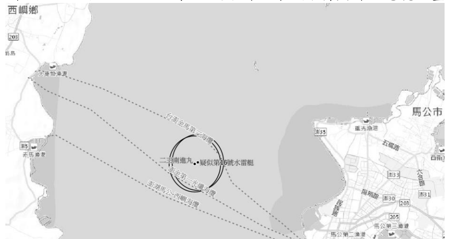
圖 1 二三南進九及疑似第 16 號水雷艇環域分析與海底電纜重疊