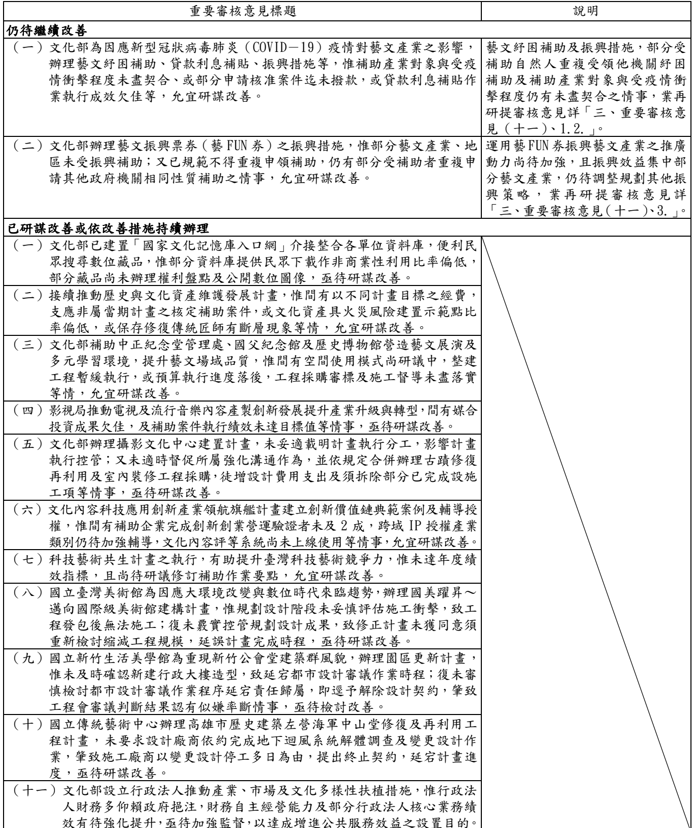
表 22 109 年度審核報告所列文化部主管普通公務相關重要審核意見覆核辦理情形

本部於 109 年度審核報告內列普通公務相關重要審核意見 13 項，經賡續追蹤查核實際辦理結果，仍待繼續改善者 2 項、已研謀改善或依改善措施持續辦理者 11 項（表 22），其中仍待繼續改善者，經再研提審核意見 1 項通知檢討改善。