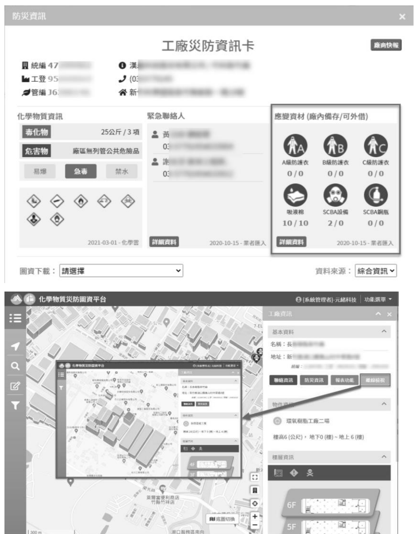
圖 2 化學物質及災防圖資平台