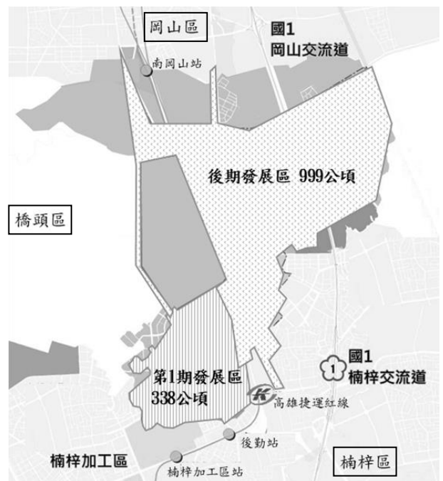
圖 2 高雄新市鎮分區示意圖

行政院為紓解高雄市都會區中心都市成長壓力，於 81 年 8 月核定高雄新市鎮開發執行計畫，主要規劃住宅區及商業區用地，計畫人口 30 萬人。開發期間，監察院對於高雄新市鎮開發執行計畫之規劃審議、開發執行等，核有多項違失，分別於 90 年 5 月 30 日及 97 年 11 月 25 日依法予以糾正。營建署自 97 年經監察院糾正後迄 108 年底，實際僅開發完成第 1 期發展區土地面積 338 公頃，後期發展區尚待開發土地面積約 999 公頃（圖 2）。經查營建署後續辦理高雄新市鎮開發執行計畫情形，核有：1. 營建署為規劃設計開發之主辦機關，卻耗時 5 年餘始確認開發主體、經費分擔及與高雄市政府權責分工方式等，且已知悉高雄地區產業用地有供不應求情況，仍未依經濟部工業局分析結果，規劃產業專用區辦理期程，嗣行政院於 107 年 7 月指示，始規劃納入科學園區，並重新修正開發執行計畫，惟截至 108 年底止，距行政院秘書長於 100 年 7 月指示已逾 8 年，開發執行計畫仍未完成