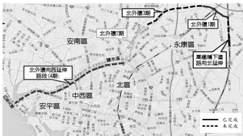
圖 3 臺南都會區北外環道路工程分期示意圖