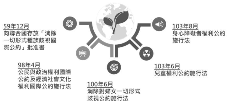
圖 2 推動國際人權公約具國內法效力歷程圖

權利國際公約、經濟社會文化權利國際公約：98 年 4 月 22 日制定公布「公民與政治權利國際公約及經濟社會文化權利國際公約施行法」（下稱兩公約施行法），同年 12 月 10 日施行，主管機關為法務部；行政院已依兩公約施行法第 6 條規定，分別於 101 年 4 月、105 年 4 月公布 2 次國家報告。