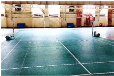
工廠區改作羽球場使用情形