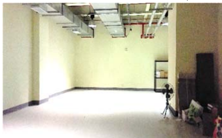
員工區低度使用情形