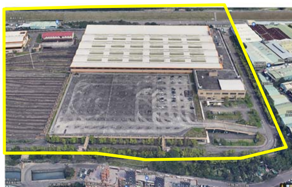
蘆洲機廠儲車區上方人工地盤停車場工程興建案

徵收及闢設計畫道路，作業時程迄未獲確定，為免都市計畫變更審議、區段徵收及闢建計畫道路等期程，影響停車場興建與啟用，經函請檢討改善。據復：本案經捷運工程局參採新北市政府建議同步研擬可行替代方案，並於 112 年 2 月 21 日與新北市政府相關局處召開匝道出入動線研商工作會議，取得車道出入口備選方案共識，調整出